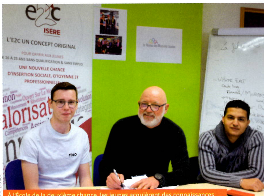
À l'École de la deuxième chance, les jeunes acquièrent des connaissances de base en français, en bureautique et en mathématiques.

Le Département, la fondation Impala Avenir, l'École de la deuxième chance et l'IMT de Grenoble accompagnent la mise en place d'une formation aux métiers de la fibre optique.